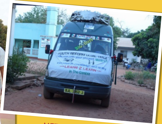
MET EEN BUSJE TREKKEN WE HET HELE LAND DOOR