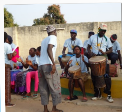
DJEMBÉS EN T-SHIRTS DANKZIJ SPONSORING UIT NEDERLAND