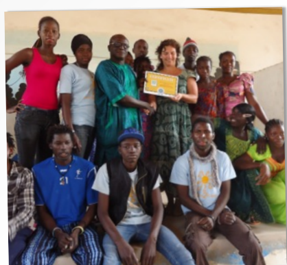
DIRECTEUR SCHOOL TROTS OP HET CERTIFICAAT

Wij zijn ontzettend trots op deze fantastische groep jongeren die heel hard heeft gewerkt. Niet alleen aan hun eigen toekomst maar ook aan die van anderen.