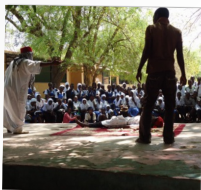
OPTREDEN OP ÉÉN VAN DE SCHOLEN IN HET BINNENLAND